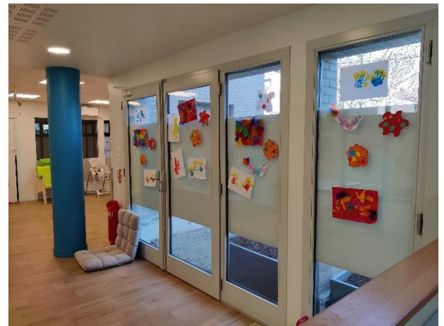
Lieu de vie pour les enfants